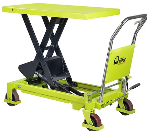
TABLE ÉLÉVATRICE 800 kg

Les tables élévatrices avec pédale à pompe hydraulique sont l'outil idéal pour tous types d'opérations de levage et de chargement. Elles sont pratiques et peuvent être utilisées comme « plan de travail » pour faciliter les conditions de travail des opérateurs. Elles représentent la meilleure solution pour un chargement manuel, combinant fonctionnement, réduction des coûts et sécurité de l'opérateur pendant le travail