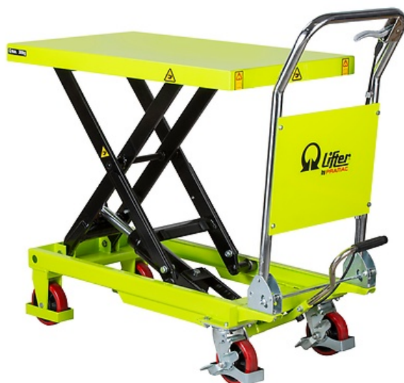
TABLE ÉLÉVATRICE 300 kg

Les tables élévatrices avec pédale à pompe hydraulique sont l'outil idéal pour tous types d'opérations de levage et de chargement. Elles sont pratiques et peuvent être utilisées comme « plan de travail » pour faciliter les conditions de travail des opérateurs. Elles représentent la meilleure solution pour un chargement manuel, combinant fonctionnement, réduction des coûts et sécurité de l'opérateur pendant le travail.