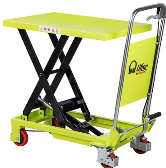
TABLE ÉLÉVATRICE 150 kg

Les tables élévatrices avec pédale à pompe hydraulique sont l'outil idéal pour tous types d'opérations de levage et de chargement. Elles sont pratiques et peuvent être utilisées comme «plan de travail» pour faciliter les conditions de travail des opérateurs. Elles représentent la meilleure solution pour un chargement manuel, combinant fonctionnement, réduction des coûts et sécurité de l'opérateur pendant le travail.